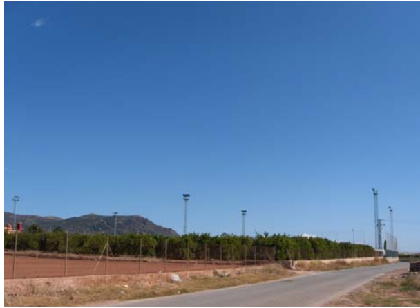
Iluminación de los campos de fútbol y vegetación circundante.